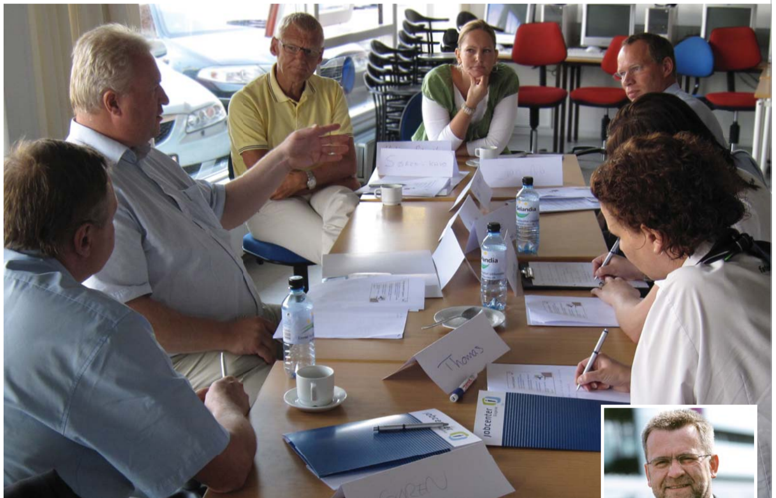
En af grupperne arbejder med temaet: "Vejen til kompetent arbejdskraft i virksomhederne".